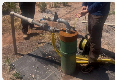
Medida de nível da água em poço do Condomínio Terras de Jurumirim.