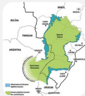
Representação esquemática do Aquífero Guarani