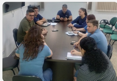
Reunião na Secretaria Munic. Agricultura, Pecuária e Meio Ambiente em Santo Antônio da Platina/PR. Representantes da ANA, SGB e IAT/PR.