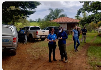
Técnicos da ANA, SGB e IAT/PR no bairro Palmital em Santo Antônio da Platina/PR.

Para saber mais, acesse: Sistema Aquífero Guarani YOUTUBE . Aquífero Guarani- SGB .