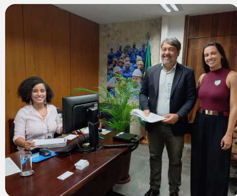
A entrega foi realizada no Gabinete da Liderança do Governo (Senador Otto Alencar/BA)

A carta aberta da ASÁGUAS sobre nomeações para a Diretoria Colegiada da ANA circulou na Esplanada e na imprensa, ganhando visibilidade e angariando forte apoio para a causa defendida pelos servidores da Agência.