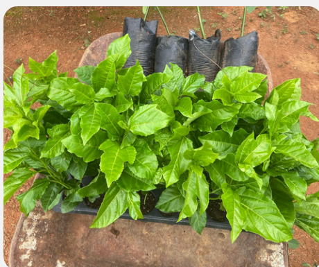
Mudas para horta comunitária são adquiridas e projeto avança para fase de plantio.

Atualmente, já foram adquiridas mudas de diversas espécies, como limão, tangerina, laranja bahia, laranja pera, graviola, tamarindo, pitaya, maracujá, abacate e pequi, que serão cultivadas no espaço.